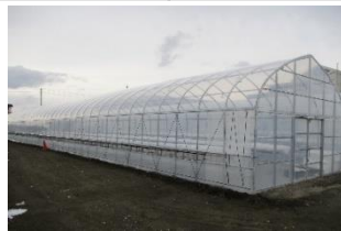
導入施設(経営発展支援事業)