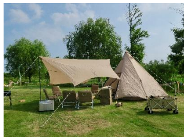
キャンプ形式の宿泊