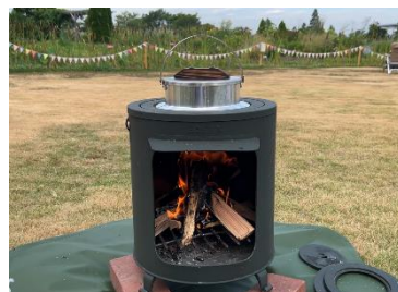
仙台米の炊飯体験