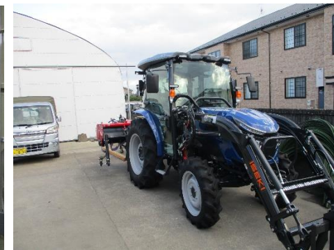
導入したトラクター (担い手確保・経営強化支援事業)