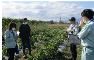
新規就農者の巡回指導