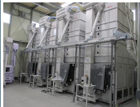
導入した乾燥調製施設 (農地利用効率化支援事業)