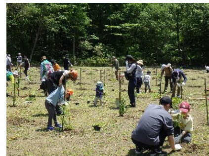
市民参加イベント