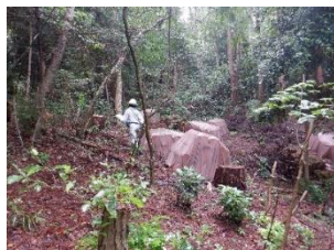
被害木くん蒸処理状況