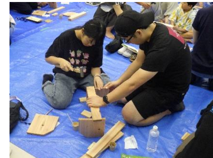
夏休み親子木工教室