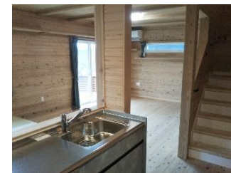
地元産材使用状況