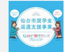
奨学金返還支援事業