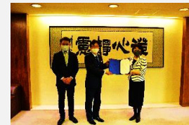
進出企業による立地表明式

仙台蒲生産業団地について、市有地の利活用を希望する事業者の募集や契約に関する手続きを円滑に実施するとともに、当団地全体に産業集積を図るため、企業誘致活動を実施します。また、震災前の水準以上に回復した仙台湾区のコンテナ取扱量のさらなる増加を目指し、官民一体となった枠組みによって各種事業を実施します。