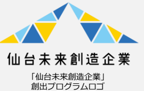
仙台未来創造企業

本市企業の海外市場開拓を支援するため、オンラインセミナーやオンライン商談会、仙台-タイ経済交流サポートデスクによるテストマーケティング出張の代行、ジェトロ海外拠点などの利活用促進に取り組みます。