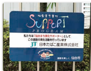
まち美化活動への参加

オンラインでのデマンド管理やCO 2 換算係数の適切な管理を実施。加えて、ハイブリッド車の導入やエコドライブ推奨によりGHG削減を進め、まち美化活動を通じ地域環境への貢献にも取り組んでいます。