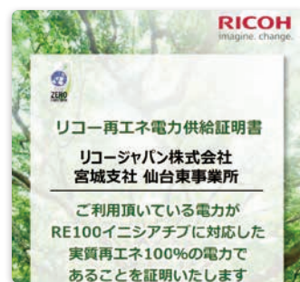
再エネ電力証明書

事業所電力をRE100に対応した「実質再エネ100%、CO 2 排出量ゼロ」の自社電力メニューに切り替え、再エネと省エネソリューションをお客様へご提供することで環境負荷削減に貢献しています。