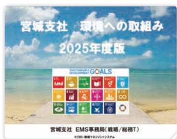
年次環境方針の策定

GHG・水・廃棄物に関する年次環境方針を策定し、定期的なフィードバックを実施。さらに、全社員を対象とした環境教育を行うことで、組織全体で環境配慮行動を実践できる体制づくりを推進しています。