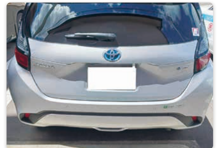
社用車のハイブリッド車への切替

社用車をハイブリッド車へ切り替えることで、走行時の燃料消費とCO 2 排出量の削減を図っています。環境負荷の少ない車両運用への転換を通じ、より持続可能な業務活動を推進しています。