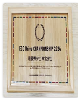
エコドライブ選手権への参加

ガソリン使用量の削減を図るため、社内イベント「エコドライブ選手権」へ参加し、燃費向上の意識づけとエネルギー使用量の見える化を推進しています。