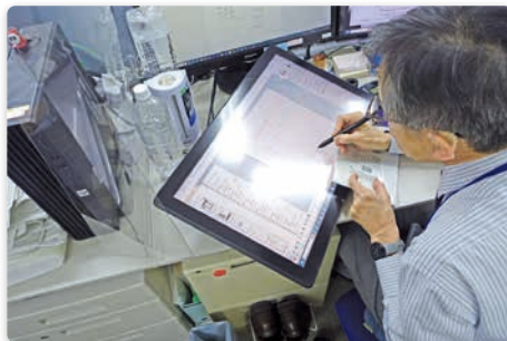
タブレットの導入

従来は設計図面を印刷し手書きで検査していたところ、タブレットを導入し、画面上でチェックを行う運用へ移行。紙使用量の大幅削減と作業効率の向上を実現しています。