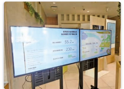
太陽光発電量のリアルタイム監視

デマンド監視による電力使用量の管理や社屋内の節電を実施。太陽光発電量のリアルタイム監視、照明のLED化、遮熱フィルムの貼付など、多面的な省エネ対策で使用エネルギーの削減に取り組んでいます。