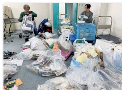
手作業による資源の分別

事務所の移転に際しては、単に廃棄するのではなく、売却・寄贈・譲渡の活用に加え、紙類などの資源を手作業で丁寧に分別し、リサイクルしました。その結果、当初100tを見込んでいた廃棄物量を12tまで大幅に削減することができました。環境負荷低減を考慮した業務運営により、常に廃棄物発生抑制に取り組んでいます。