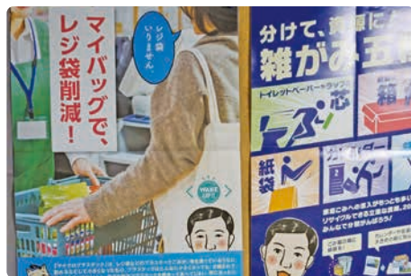
社内でのポスター掲示

掲示板にポスターを掲示し、ごみ減量やリサイクルの呼びかけ、マイバッグ利用促進などの啓発を実施。来訪者や職員への周知を通じ、日常的な環境配慮行動の定着を図っています。