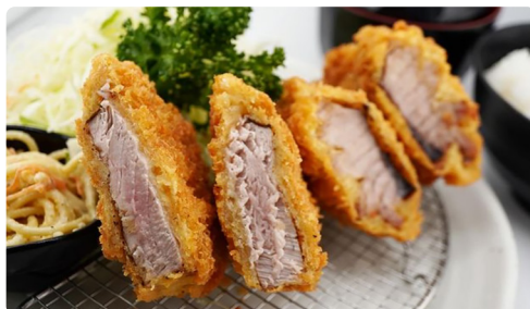
時間のないランチタイムに効率のいいサービスを

これまでは、ご案内→注文のお伺い→配膳→下膳→会計の工程をすべてスタッフが担っていましたが、オーダーシステムと配膳ロボットの導入により、ご案内→下膳→会計のみのオペレーションで済むようになりました。そのため、注文や会計の際に、お客様にお待ちいただくことも格段に減り、サービス向上に繋がったと感じています。