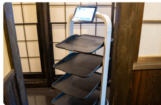
ロボットがそれぞれの個室まで料理を配膳

出来上がった料理をお客様のところまで運ぶ配膳ロボットを導入しました。お客様に受け入れられるかどうか心配でしたが、導入するお店が増えていることもあり、混乱なく活用することができています。そして、人手不足だったスタッフの手間を格段に減らせることができました。