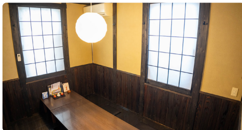
大人数の宴会でもゆとりを持って対応できるように

これまでは4人で回していたホール運営も、3人での対応が可能になりました。その分、調理やサービスにも時間がかけられるようになり、ゆとりを持った料理提供に繋げることができています。