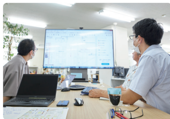
リモートでの会議で効率性もアップ

チャットツールの導入により指示やアドバイスは時間・場所を問わず可能となりました。すぐに情報共有ができるため、手戻りも少なくなりました。図面などはすべてデータ化し、紙の使用頻度も激減。紙の資料で溢れていた事務所もすっきり整理されました。