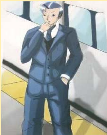
北部あーちる (平成14年4月開所)