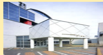
南部あーちる (平成24年1月開所)