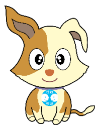
行政相談マスコット キクーン

※総務省行政相談センター「きくみみ宮城」（仙台第2合同庁舎11階）でも、行政一般相談に応じます