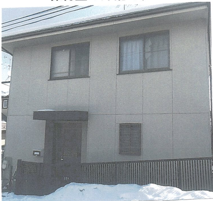
保育室の外観です