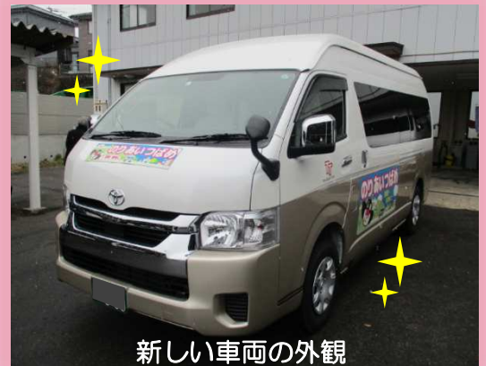
新しい車両の外観