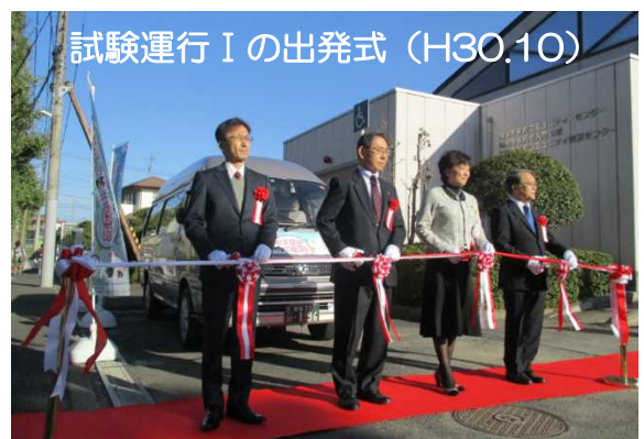
試験運行 I の出発式 (H30.10)

本格運行への移行を記念し、 出発式 を開催します。日時は 4月2日(金)8時40分 から予定しており、場所は 燕沢コミュニティセンター前 です。詳細は 町内会長 にお問い合わせください。皆様のご参加をお待ちしております。