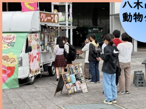
八木山動物公園駅

駅周辺のにぎわい創出や、駅の利便性・快適性の向上に向け、駅前ロータリーでは今年度より様々な催しが開催されています。毎週金曜日には個性あるキッチンカーが出店する「八木山駅前ハッピーフライデー」を開催しています。