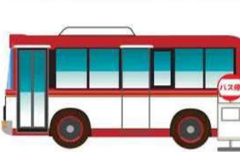
※イラストはイメージです。実際の車両とは異なる場合があります。