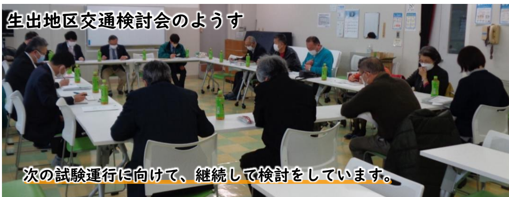
次の試験運行に向けて、継続して検討をしています。

10月から次の試験運行を開始できるように、検討しています。 ※まだ決まったものではありません