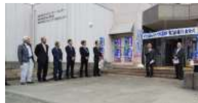
出発セレモニーの様子

運行期間は来年3月31日までの1年間で、月・水・金の週3回運行します。本格導入に向けた最終ステップとなりますので、この機会にぜひご利用ください。