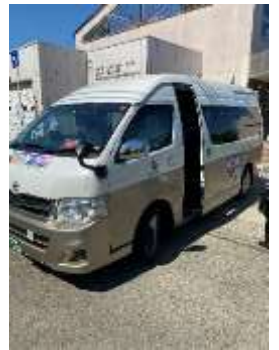
のりあい・つばめ