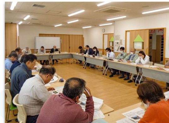
▲ 第4回検討会の様子

令和5年11月6日に開催した検討会では、「高齢者をターゲットにした予約型の地域交通」と「小学生をターゲットにした定時定路線型の地域交通」を組み合わせる運行を目指して、乗降場所、運行時間帯、運賃など具体的な運行イメージについて、検討会の皆さんと意見交換しました。