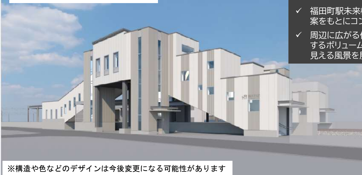
駅舎外観パース図 (南側市道側から見たイメージ)