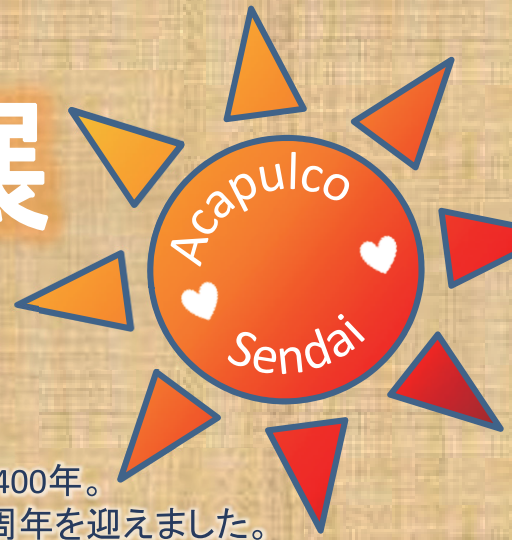
Photo exhibition in commemoration of the 40 th anniversary of the sister city relationship between Sendai and Acapulco

支倉常長ら慶長遣欧使節が、メキシコ・アカプルコ港に上陸してから400年。歴史的な縁から仙台市とアカプルコ市は姉妹都市となり、今年で40周年を迎えました。アカプルコ市の美しい風景や街並みと、両市の交流の様子を写真でご紹介します。