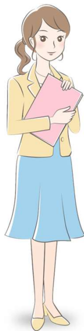
きゃりこ サービスイメージキャラクタ

参加者の利用料は完全無料です。納得のいくまでインターンシップに参加してほしいという想いがあり、より多くの企業・インターンシップとマッチングしてもらいます。