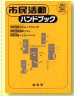
1998年 市民活動ハンドブック