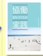
2017年 協働の手引き・事例集