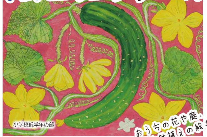
小学校低学年の部