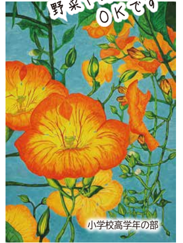
小学校高学年の部