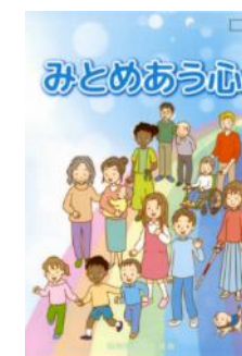
人権教育資料 小学校版