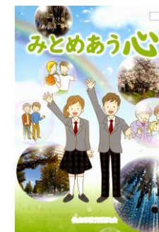
人権教育資料 中学校版