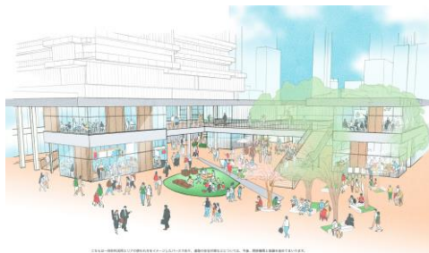
北東から見たイメージ（低層部）

新本庁舎は周辺エリアとのにぎわいの相互波及やまちの回遊性向上を図るため、低層部には民間活力の導入等により市民等が日常的に利用できる機能を設けるとともに、休日等におけるイベント開催時には、勾当台公園市民広場等との一体的な利活用を進めることとしています。