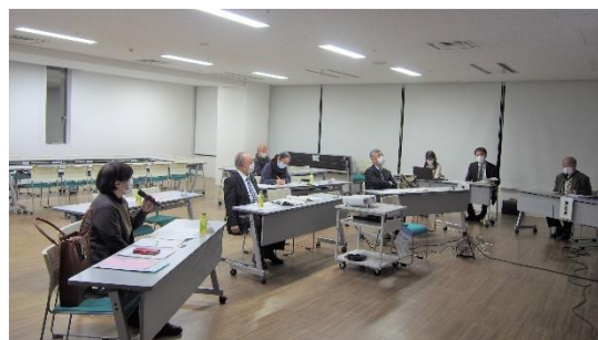
事業計画説明会（令和4年3月開催）の様子