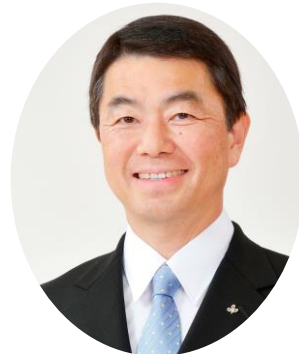
宮城県企業立地セミナー実行委員会 委員長 宮城県知事 村井 嘉浩

つきましては、御多忙のところ誠に恐縮ではございますが、是非とも御来場を賜りますようお願い申し上げます。