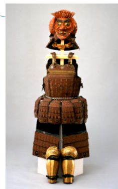
仙台市指定文化財 朱鍍漆紫糸素懸威六枚胴具足 三笠荒神形兜付 伝上杉謙信所用 展示期間：2026/2/17(火) - 4/5(日)