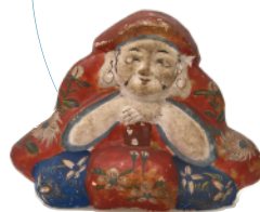
花巻人形 大黒 展示期間：2025/12/16(火) - 2026/3/15(日)