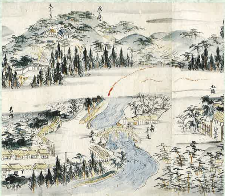
「仙台領奥州街道絵図」に描かれた長町橋 長町側(左)の街道が橋の手前で曲がって広がっているのがわかる。江戸時代中期(仙台市博物館蔵)