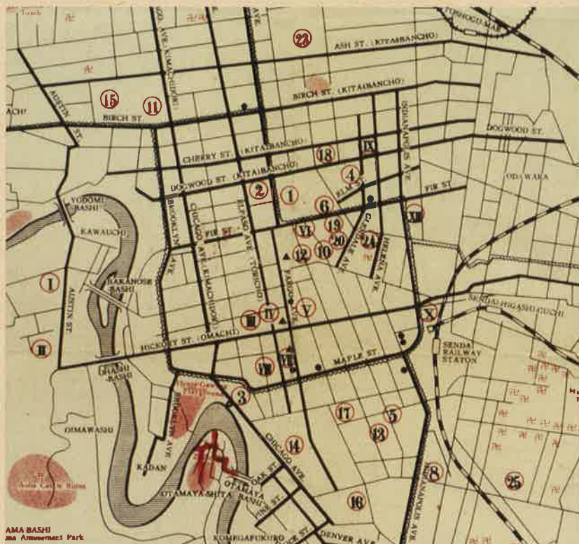
昭和20年代半ば頃に占領軍が作成した 仙台の地図「map of SENDAI」(部分)