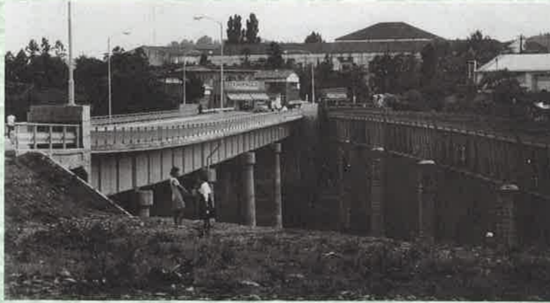
昭和36年竣工の新瀬橋(左)と明治25年竣工の旧瀬橋(右) 昭和37年(小野幹撮影)

旧瀬橋の名残である幅広の丁字路から堤防側を覗くと、いまも古い橋脚の一部を見ることができます。