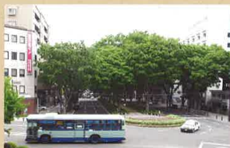
現在の定禅寺通(ほぼ同じ場所を撮影した)