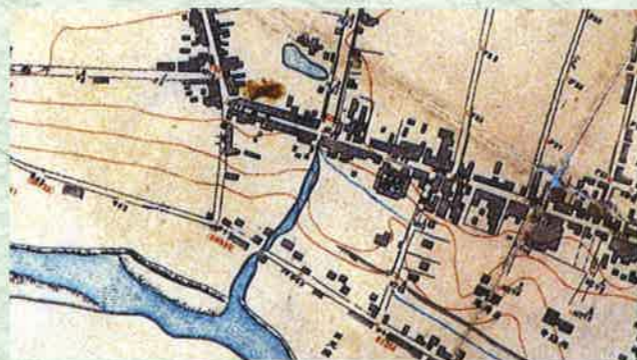
「仙台市測量全図」に描かれた水路 明治26年

この側道と土樋緑地の地下にある下水管と雨水吐き口はまだ現役で、現在も大雨の際に機能しています。