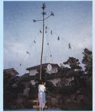
初盆や年忌に立てる灯籠柱 (若林区荒浜 平成8年)