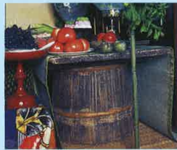
味噌桶に餅の伸び板を載せた盆棚 (泉区福岡 平成8年)

『仙台市史 特別編6 民俗』で、守り伝えられてきた「日常」を見つめなおしてみませんか。