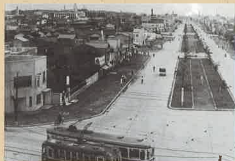
植樹されて間もない、昭和30年代半ば頃の定禅寺通