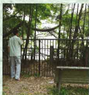
土樋緑地の突き当たりは広瀬川下には、暗渠水路の吐水口がある