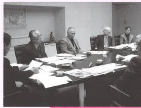
いろいろな話題が飛び出した座談会

編さん室では、平成19年度刊行予定の『特別編9 地域史』に地元学の協力が欠かせない、と考えています。そこで地元学に携わる人たちに集まっていただき、座談会を開きました。この模様や、市内での地元学の現状など、地元学を特集する『市史せんだい』Vol.10は、8月刊行予定です。