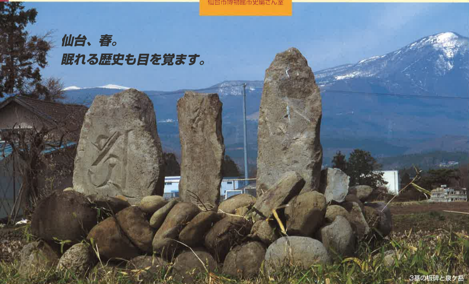
3基の板碑と泉ヶ岳