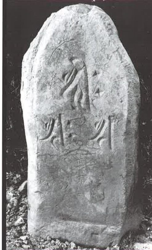
東光寺板碑群 64号碑 (宮城野区) 中央に3つの梵字が彫られています

板碑とは鎌倉時代から室町時代にかけて造られた供養塔の一種です。石に大日如来や阿彌陀如来などを表す梵字などを刻み、建てた時期や理由、建てた人の名前などを記したものが一般的です。板碑は当時の人びとが残してくれた非常に貴重な資料なのです。