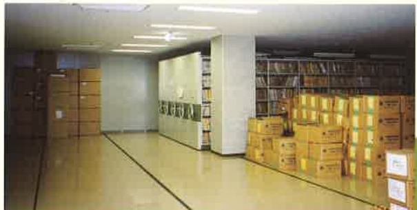
神奈川県立公文書館の保存庫

公文書保存の体制と保存庫の設置は、長い年月をかけて確立されることでしょう。それまでは、収集した貴重な資料を大切に守りたいと思います。