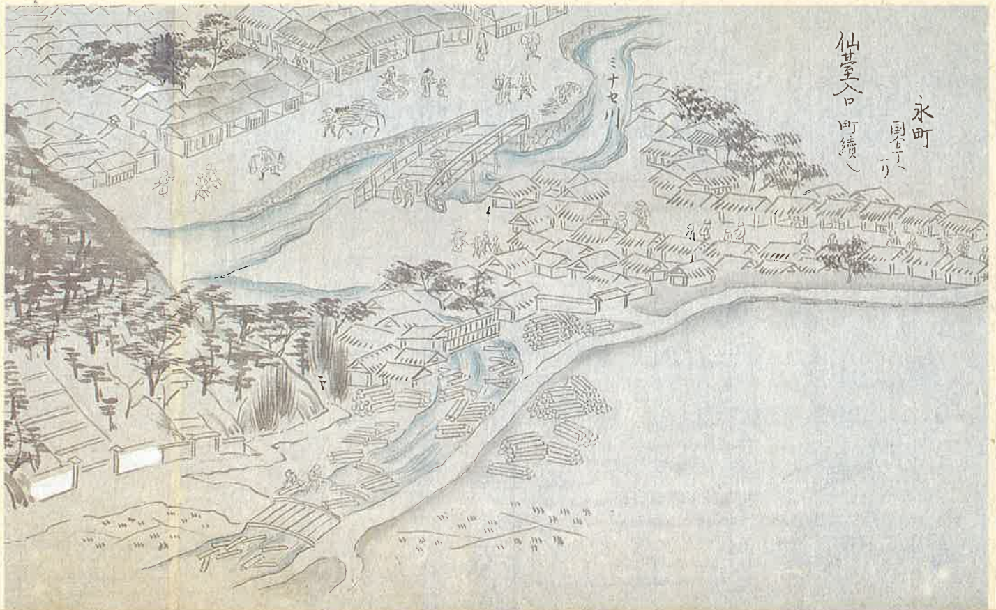
長町の木場「奥州街道絵図」個人蔵 福島県歴史資料館寄託