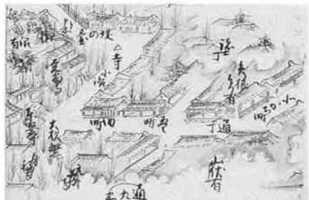
仙台下北線治町周辺のようす。茅葺の屋根が多く見受けられる。

仙台下の7割近い面積を占める武家屋敷の多くは、一部に瓦葺の塀や門が見受けられるものの、上級家臣を中心にこけら葺の建物も多く、下級家臣の場合は町屋敷と同じく茅葺が中心であったと推定され、仙台下全体を見ても瓦の使用はかなり限られていた模様。