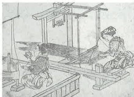
機織りをする女性たち。家庭内の仕事にとどまらず、屋敷の所有という形で社会的な立場を獲得していた。

男性が社会的な表舞台にあったと思われるが、江戸時代において、江戸時代末期の仙台下では女性も町屋敷を所有し、名義人になれたことが明らかに。城下の中心であった大町三四五丁目の軒帳（町屋敷の台帳）を分析した結果、少数ではあるが、女性が売買や相続によって町屋敷を有していたことが判明。同時にこうした屋敷を所有する女性も、五人組の構成員、すなわち共同体の構成員として認められていた可能性が強くなった。18世紀初めに作られた同町の軒帳に女性名義人は見えないことから、江戸時代後期以降に徐々に女性の社会進出が進んだものと思われる。