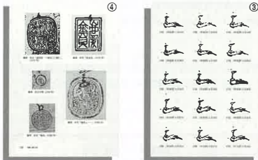
①本文 ②別冊の写真図版 ③別冊の花押一覧 ④別冊の印章部分の原寸大写真図版