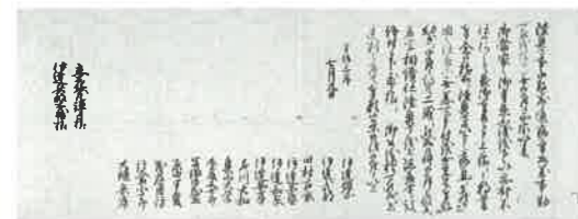
綱宗の隠居を願う証文は、万治3年（1660）7月に伊達一門や奉行など14人によって署名された。

仙台藩分割を狙った陰謀、あるいは朝廷との結びつきを幕府が警戒したためなど、三代藩主伊達綱宗の突然の逼塞、隠居についてはいろいろな憶測が飛び交っていたが、今回その真相が明らかに。消息筋によると、綱宗は家督相続後間もない時期から遊蕩が目立ち、親類の岡山藩主池田光政、柳川藩主立花忠茂らは仙台藩の重臣を交えてたびたびその対応を協議。老中酒井忠清を通じて綱宗に注意を促したものの失敗。やはり伊達家の親類筋で御三家水戸の徳川頼房（徳川光圀の父）も注意したが綱宗は受け入れず。このままでは藩の存亡にかかわると判断した親類大名と藩の重臣が相談の結果、ひそかに幕府へ綱宗隠居を願い出たものと判明。伊達騒動の発端となった事件の謎が解明された。