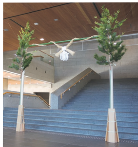
伝統的な門松再現展示のようす (令和6年撮影)