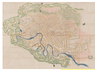
仙台市指定文化財 仙台城下絵図 寛政元年(1789)頃 展示期間：12/16～3/15