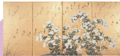
重要美術品 菊花図屏風 伊達政宗詩歌書き込み 展示期間：12/23～2/15