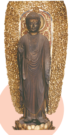
宮城県指定文化財 阿弥陀如来立像 個人蔵