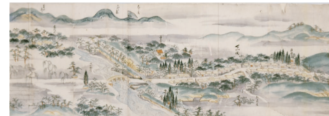
仙台領奥州街道絵図(七北田部分) 荒川如慶筆