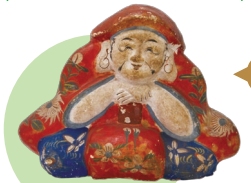
花巻人形 大黒 展示期間：12/16～3/15