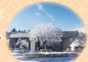
仙台市博物館外観

雪景色の中にたたずむ博物館は、まるで時間が止まったかのように幻想的な雰囲気。 そして館内では、冬ならではの展示やイベントなど、楽しい企画があなたを待っています。 初めて訪れる方も博物館ファンの方も、きっとわくわくする体験ができるはず。 冬こそ、博物館で心あたたまるときを過ごしてみませんか？