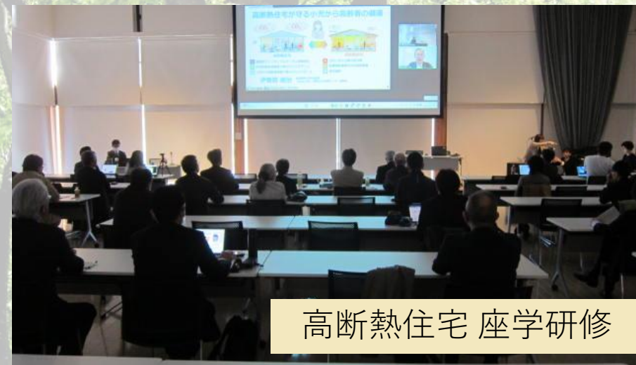
高断熱住宅 座学研修