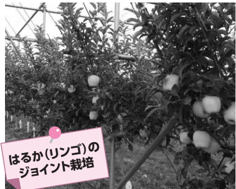
はるか(リンゴ)の ジョイント栽培