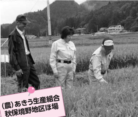
(農)あきう生産組合 秋保境野地区ほ場

8月30日(金)、農作物の生育状況を把握するため、郡市長が農業視察を行いました。