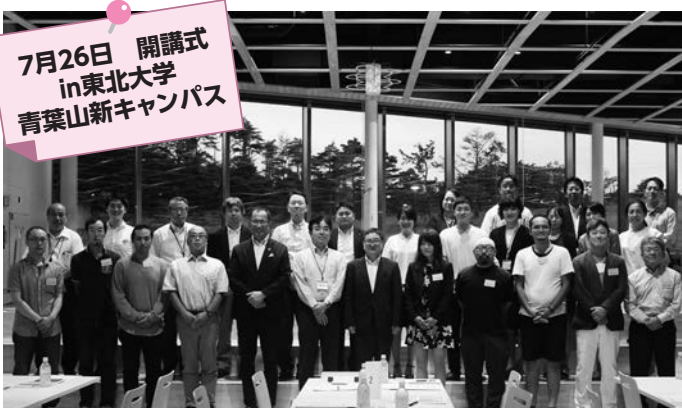
7月26日 開講式 in東北大学 青葉山新キャンパス

市では、7月から、(公財)ずいせい ずいせい 農学振興会・東北大学農学研究科に委託し、「せんだい次世代農業経営者育成ゼミ」を開講しています。このゼミでは、次世代の本市農業を担うプロの農業経営者の育成を目的としています。