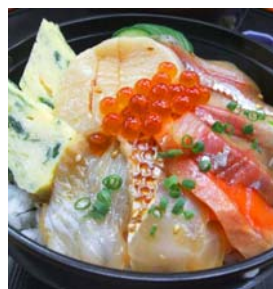
〔新名物「仙台づけ丼」〕