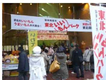
〔中心部商店街から、東北の復興に向けた取組みと観光情報を発信〕