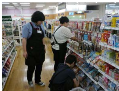
〔セミナーや就業体験などによる人材育成、就職支援を実施〕