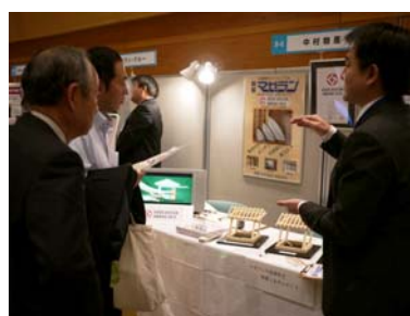
〔販路拡大、企業間マッチングへの支援を実施〕