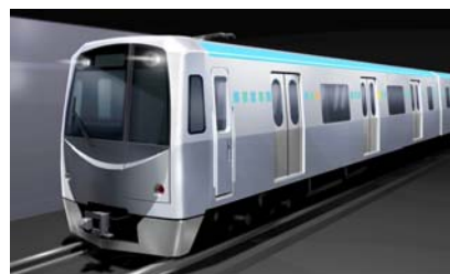
〔東西線沿線の魅力を発掘〕