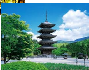
〔情報発信により 仙台・東北への誘客を促進〕