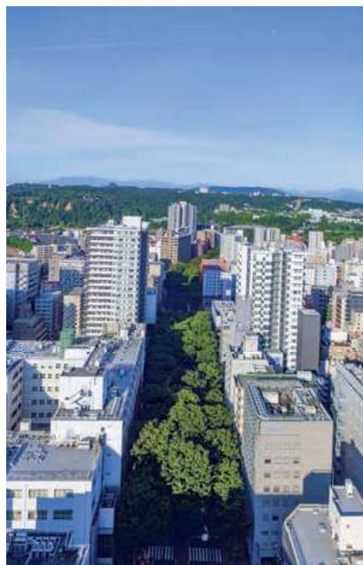
▲上空から見た青葉通