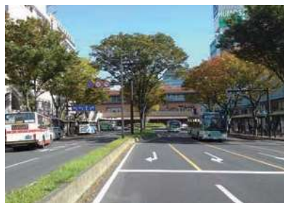
▲秋の青葉通と仙台駅