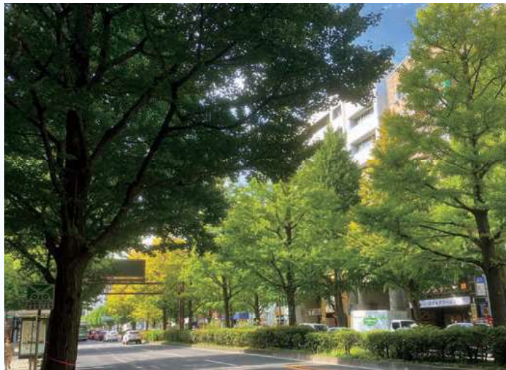
▲色づき始めたイチョウ