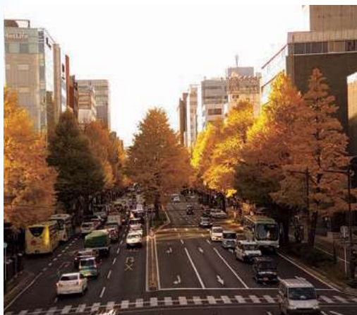
▲黄金に染まるイチョウ