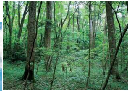
▲里山の霧囲気が残る

木の実ふる蕃山延命地蔵尊 高宮義治 今まさに飛び立つように花咲かす 群落したる片栗の花 早坂保文