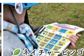
ネイチャービンゴ