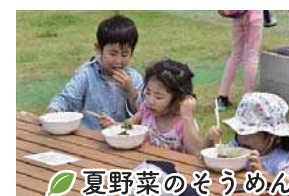
夏野菜のそうめん