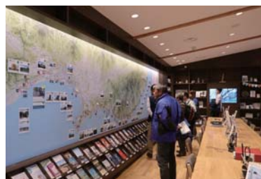
トレイル全線の大型マップが ある情報コーナー