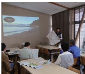
会議室や実習室、講義室があり、 環境教育のプログラムで利用可能

2019年4月にオープンした名取トレイルセンターは、青森県八戸市から福島県相馬市までの太平洋沿岸をつなぐ「みちのく潮風トレイル」の情報発信などを行う拠点施設です。みちのく潮風トレイルのハイカーに向けたサービスの提供だけでなく、地域と連携して環境教育プログラムを実施し、ハイカーと地域住民の交流の機会を作っています。ふるさとの杜再生プロジェクトでも、トレイルセンターと連携して、ハイカーが気軽に参加できる育樹プログラムなどを検討していきたいと考えています。