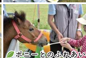
ポニーとのふれあい

次回の育樹会は 8月31日（土）10時～14時 海岸公園荒浜地区 で開催します！