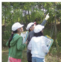
環境学習の様子 (HPから)