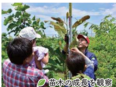
苗木の成長を観察