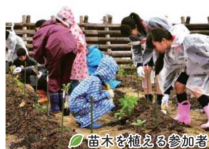
苗木を植える参加者

今回植樹した苗木は、緑の活動団体や市内の子どもたちが大切に育ててきたコナラやクヌギなど2,000本と、株式会社藤崎が用意したクロマツ2,000本の併せて4,000本です。雨合羽の彩り鮮やかな和気あいあいとした雰囲気の中、子どもも大人も協力して、丁寧に苗木を植えました。皆さまが愛情込めて育てた苗木は、恵みの雨を喜んでいるようでした。