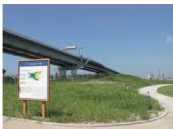
最初に植樹をした“はじまりの森” 2006年から2018年の生長の様子