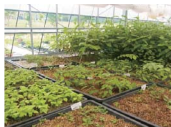
圃場(苗木の保育所)