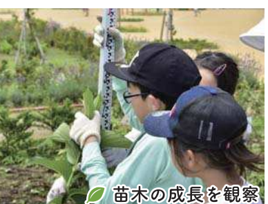
苗木の成長を観察