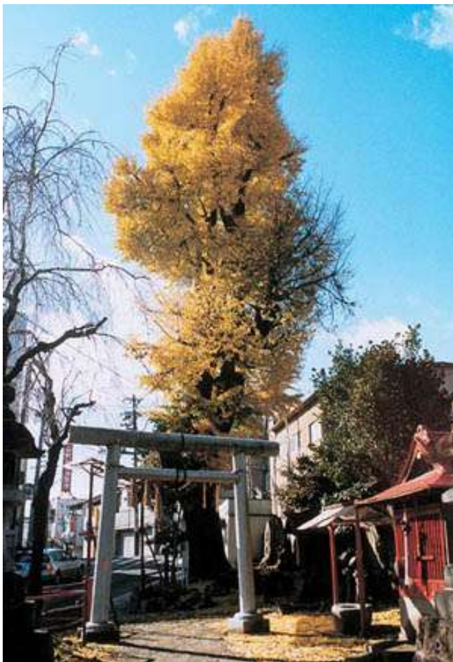
黄葉したイチョウ

このイチョウの大木は、樹齢が約320年、樹高が21mに達し、市の保存樹木に指定されています。秋の黄葉の時期は格別で、木全体が黄金色に輝き、この地域のシンボルとして親しまれています。