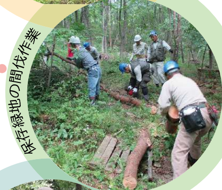
放山保存緑地の間伐作業