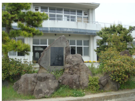
開校30周年記念碑の近くに設置する予定です。