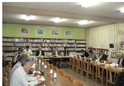
統合準備委員会の様子

東六郷小学校の地域と共に歩んできた歴史を後世に伝えるため、閉校記念碑を設置します。設置場所は東六郷小学校敷地内とし、平成29年3月完成予定です。閉校記念碑のデザインや設置の方法等については、提案を公募し事業者を選定していくプロポーザル方式を進めることとし、盛り込む内容等について検討していきます。