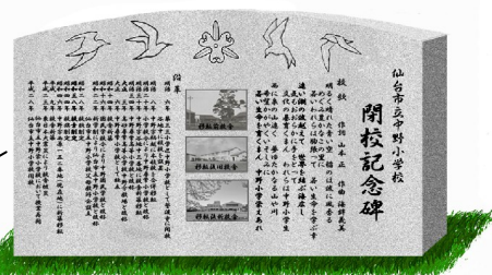
《中野小学校閉校記念碑》