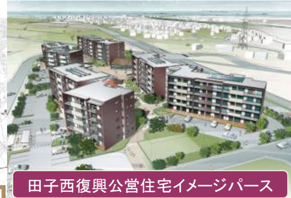
田子西復興公営住宅イメージパース