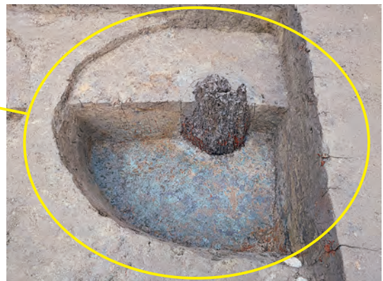
当時の柱の一部が見つかった様子