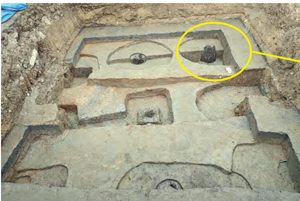
令和7年度調査地点

今後とも、発掘調査を通して郡山遺跡の当時の姿を明らかにすることで、市民の皆さまに遺跡への関心や親しみを持っていただけるよう取り組んで参ります。(担当:山口)