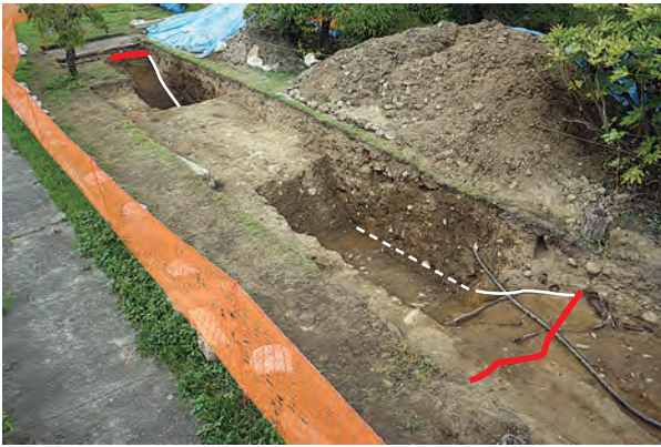
水路(堀)跡の検出状況(南東から)

この水路(堀)跡は、江戸時代の絵図でも確認され、中島池から北に延びています。仙台城を描いた現存最古の絵図である『奥州仙台城絵図』(正保2(1645)年)(仙台市博物館蔵)では、この水路について、「水落堀 幅六間 深二間半」と記載があり、1間6尺と仮定すると幅約18.18m、深さ約4.55mとなります。規模と大手門との位置関係からも、今回確認された水路(堀)跡はこの「水落堀」と同一のものと考えられます。(担当:木村)