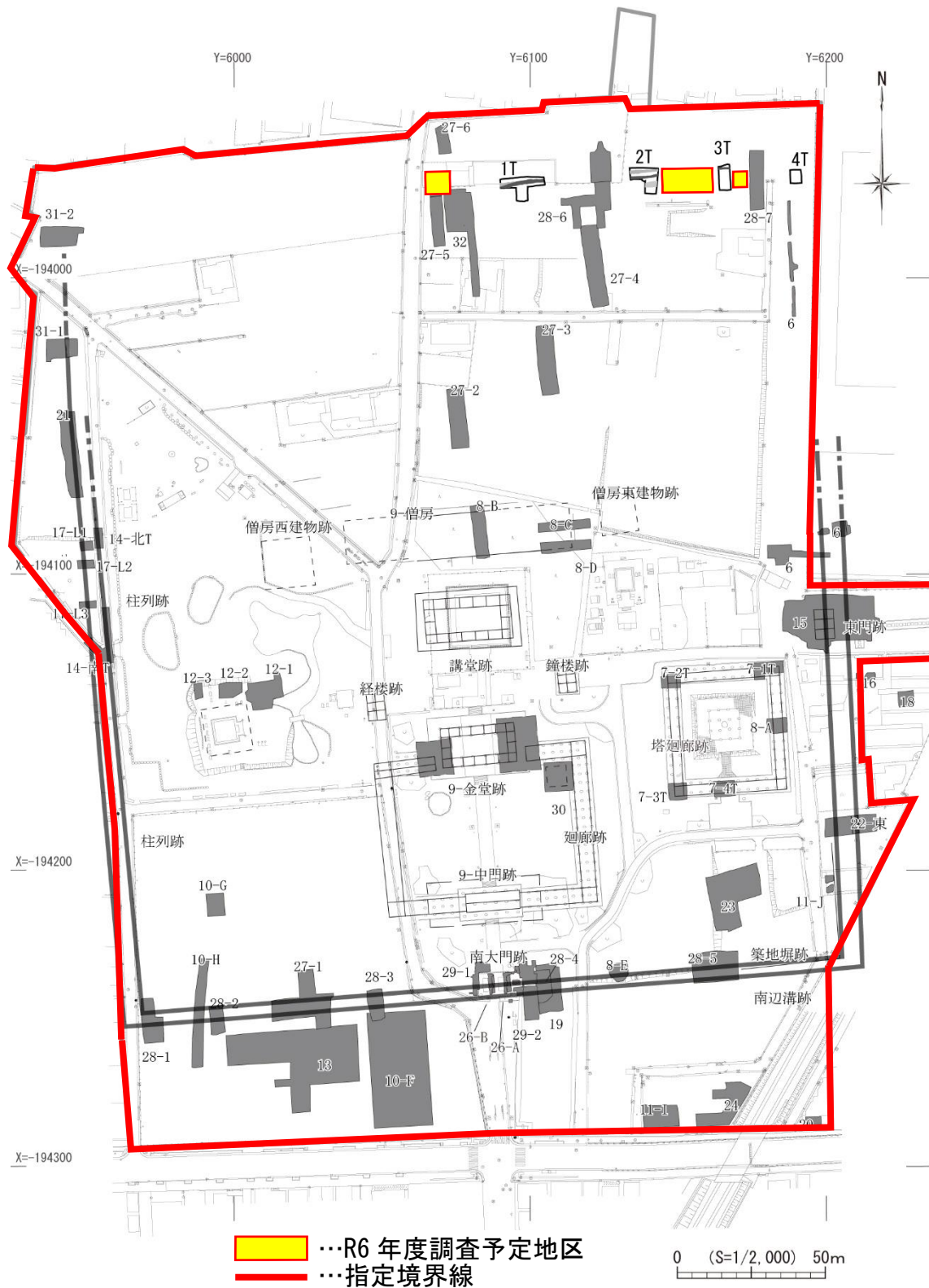
令和6年度 陸奥国分寺跡 発掘調査予定区 位置図