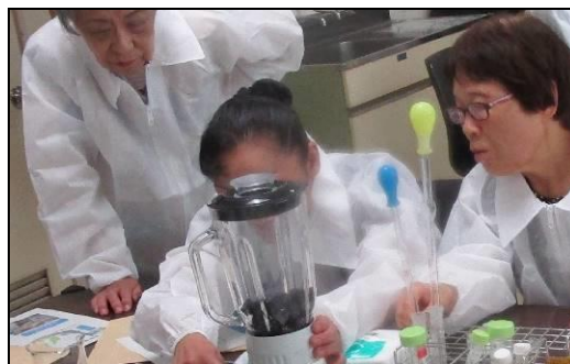
検査施設の見学会