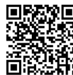
せんだいT u b e