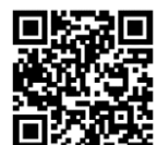
太白区チャンネル