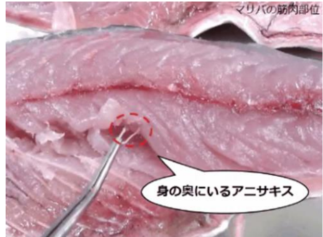
魚の身に入り込んだアニサキス