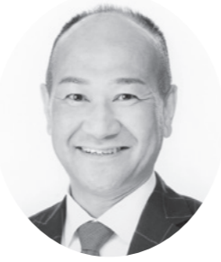
自由民主党公認候補者