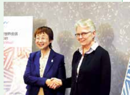
▲奥山市長とワルストロム国連事務総長特別代表（防災担当）

東北で開かれる国際会議としては、過去最大規模となるこの会議で、私たちの東日本大震災の経験と教訓、そして防災や復興の取り組みを国内外に発信しましょう。