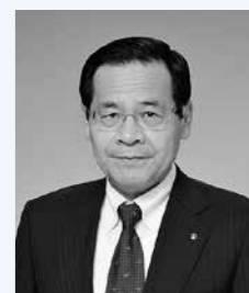
泉区長 守 修一

泉区は、豊かな自然環境に恵まれ、歴史的・文化的資源と中央地区に代表される新しい都市機能が共存するなど多様な魅力を持ち、今後さらなる発展が期待される区です。 急速に進む少子高齢化に負けないよう、地域の特性を踏まえながら、各種の地域団体や大学などの連携により、地域資源を生かしたイベントや世代間交流を促進する活動等を行い、皆