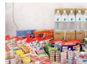
▲家族4人分の1週間分の備蓄の例

家庭の備蓄品は、普段食べているものなどを多めに購入して期限を意識しながら消費し、使った分だけ買い足す「循環型の備蓄」が有効です。