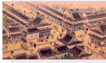
仙台名所 芭蕉の辻図 伊藤武陵画 三原良吉考証 昭和26年刊 仙台市博物館蔵

広瀬川を外堀に見立て、城下町は東側の段丘台地の上に独立してつくられました。大町から名掛丁へと東に延びてゆく大手筋の通りを東西幹線に、大町三丁目の芭蕉の辻で直交する奥州街