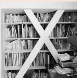
▲作り付けの本棚にもX字の筋交いを付けて強度を増しました

「診断内容や改修工事の進捗状況について詳しく説明があり、経過も実際に見ることができたので安心してお任せできました。古い家でもきちんと対策することで家族が安全に暮らせるようになり、気持ちにゆとりができました」とお話しいただきました。