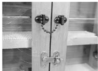
▲食器棚は、開いた扉から食器などが飛び出す恐れがあります。扉には開き防止器具を付けましょう