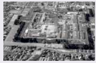
若林城跡の航空写真 (昭和59年撮影)

土地割りの方向が大きく変わる仙台の町の特異な構成は、五橋の福祉プラザ前のY字路で体感できます。