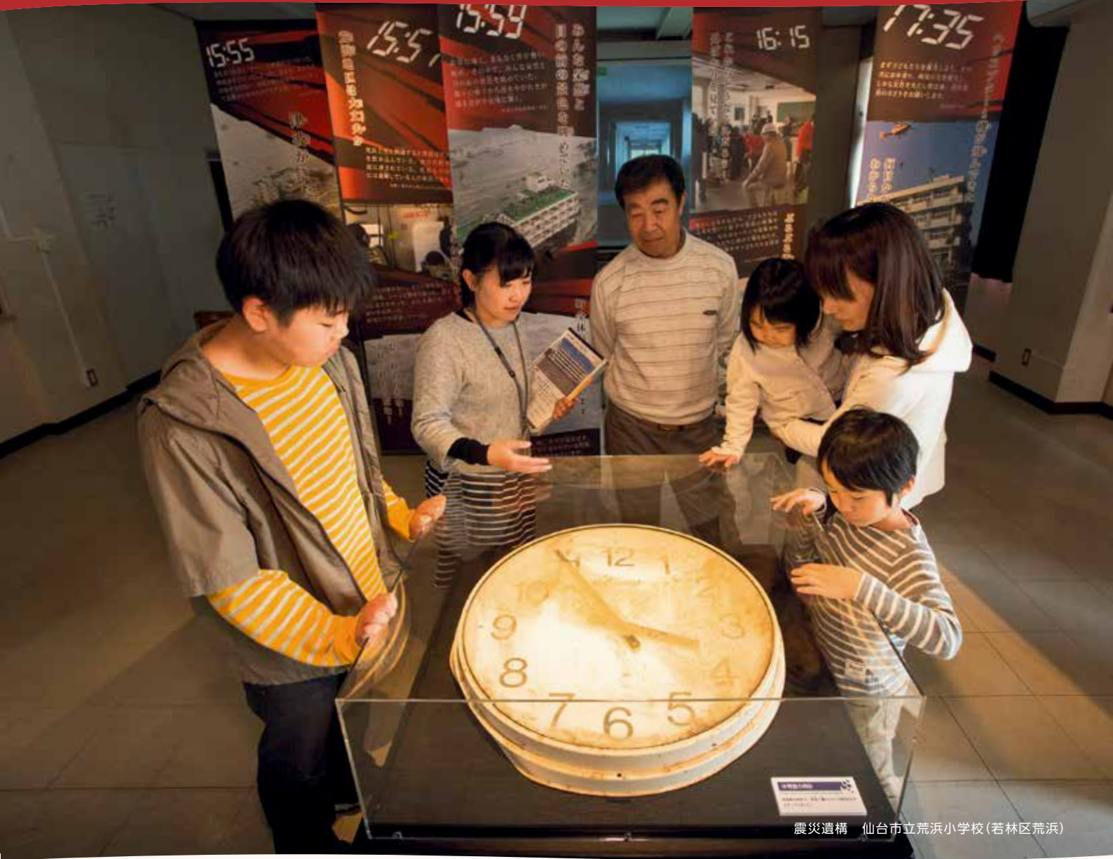
震災遺構 仙台市立荒浜小学校(若林区荒浜)

震災遺構として公開された荒浜小学校。体育館に掛けられていた時計は、津波が襲来した午後3時55分を指したまま止まっています。