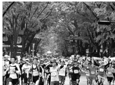
▲新緑に囲まれた定禅寺通りを走るランナーたち

5月14日、第27回仙台国際ハーフマラソン大会（杜の都ハーフ2017）が開催され、霧雨に洗われた新緑の中、1万2991人の