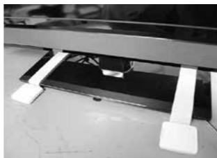
▲テレビやパソコンなど不安定で大きなものは、固定器具などで支えましょう