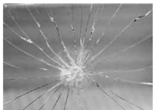
◀窓ガラスには、ガラス飛散防止フィルムを貼ることで、割れたガラスが飛び散るのを防ぐことができます