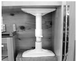
▲高さのある家具などは、突っ張り式や金具式の転倒防止具で壁と家具を固定しましょう

たんすやテレビなどの大きな家具は、支え棒やL字金具等で固定する、棚板に滑りにくい材質のシートを敷くなど、転倒・落下防止の対策をしましょう。また、万が一倒れてしまった場合でも、出入り口や通路を確保できるように、家具の配置を工夫しましょう。