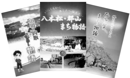
太白区役所4階まちづくり推進課で販売(1冊1,200円)しています

太白区では、地域愛を育み、地域の歴史を未来に語りつぐため、住民自らの手で地域の成り立ちや歩み等をまとめた地域誌「まち物語」や小冊子・マップを制作する団体を募集しています。また、これらの制作等に取り組む団体に対し、活動を支援するために助成金を交付します。