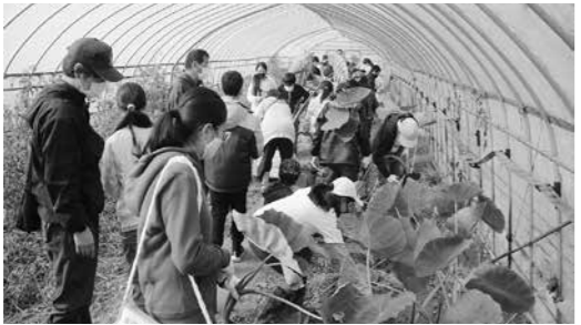
昨年度の活動の様子

申 各小学校で配布する申込用紙またははがき、ファクスに住所・氏名(フリガナ)・電話番号・学校名・学年を記入して7月12日(必着)までに(直接窓口への持参も可。はがきまたはファクスの場合は「たいはくっこくらぶ申し込み」と記入)