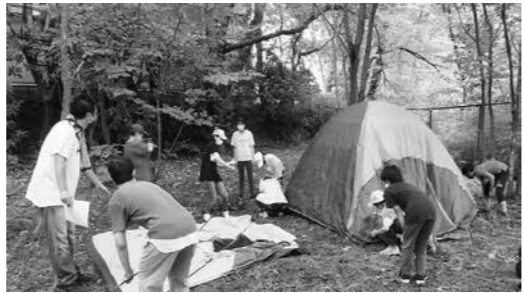
▲昨年度の活動の様子

たいはくっこらぶ参加者募集 太白区の歴史や文化、自然等について体験学習をする「たいはくっこらぶ」に参加する児童を募集します。他の学校の子もたちと友達になって一緒に学んだり、遊んだりできる楽しい企画がいっぱいです。 ●活動日＝6月18日(土)、8月7日(日)、9月17日(土)、11月19日(土)、令和5年2月5日(日)(全5回) ●対象＝区内の小学5・6年生20人 [選考]。初めて参加する方を優先 ●活動内容に応じて実費負担有り ●令和3年度の活動内容など詳しくは区ホームページ(サイト内検索で「たいはくっこらぶ」と検索)をご覧ください 申 各小学校で配布する申込用紙またははがき、ファクスに住所、氏名(フリガナ)、電話番号、学校名、学年を記入して5月10日(必着)までに(直接窓口への持参も可。はがきまたはファクスの場合は「たいはくっこらぶ申し込み」と記入)